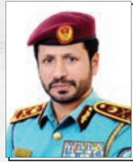
Major General Saif Al Zari Al Shamsi

Colonel Dr. Naji Al Hamadi pointed out that the new device was intended for criminal evidence personnel, particularly gunshot examiners, police and judicial entities concerned with criminal evidence collection (gunshots). He also explained the importance of the invented device, and its role in examining cartridges of various types and calibers. By means of such innovation, cartridge testing time was reduced from 5 days to 5 minutes. He also added that (50) firearms of various calibers used for testing cartridge validity can be dispensed with through the use of the invented device with its firing chamber that fits cartridges of various calibers. This, he added, helped cut the cost of at least 50 firearms of various types and calibers; the cost of a secure storage and the cost of maintenance.