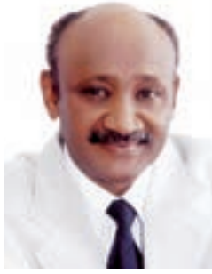
بقلم: محمد الأمين سعد