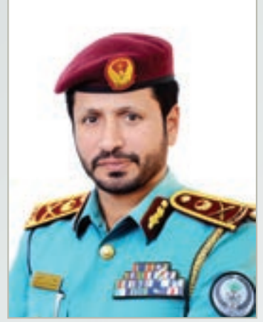
بقلم اللواء/ سيف الزري الشامسي القائد العام لشرطة الشارقة

إن إقامة الفعاليات والأنشطة الرياضية والثقافية والمجتمعية ليس بالأمر الغريب في إمارتنا الباسمة، فجميعنا ممتن للدعم الذي تلقاه فعاليات الثقافة من صاحب السمو الشيخ الدكتور سلطان بن محمد القاسمي عضو المجلس الأعلى حاكم الشارقة، وقرينته وتبنيهما لكثير من الأنشطة الثقافية والمبادرات العلمية والفعاليات التي تثري الجوانب المعرفية للكبار والصغار، وتغرس في نفوسهم حب القراءة وشغف التعلم، سعياً لأن يواكبوا تقنيات العصر ومتطلبات حياته، ليسهموا وأقرانهم في نهضة وطنهم.