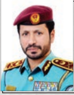
اللواء / سيف الزري الشامسي